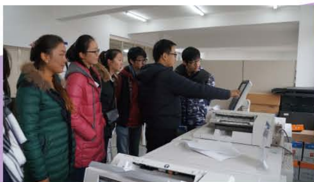
学生在新建成的“出版物制作一体化专业教室”上实训课

该专业为国家示范（骨干）高等职业院校重点建设专业，拥有专兼结合的“双师型”教学团队，建有国家级实验实训基地，致力于紧跟出版行业发展，培养掌握出版活动和新媒体传播专业知识，具有文字编辑、图文编辑、校对、网络编辑、网页设计等专业能力，具备良好人文素养、职业素质和发展潜能的技术型、复合型、创新型高素质人才。