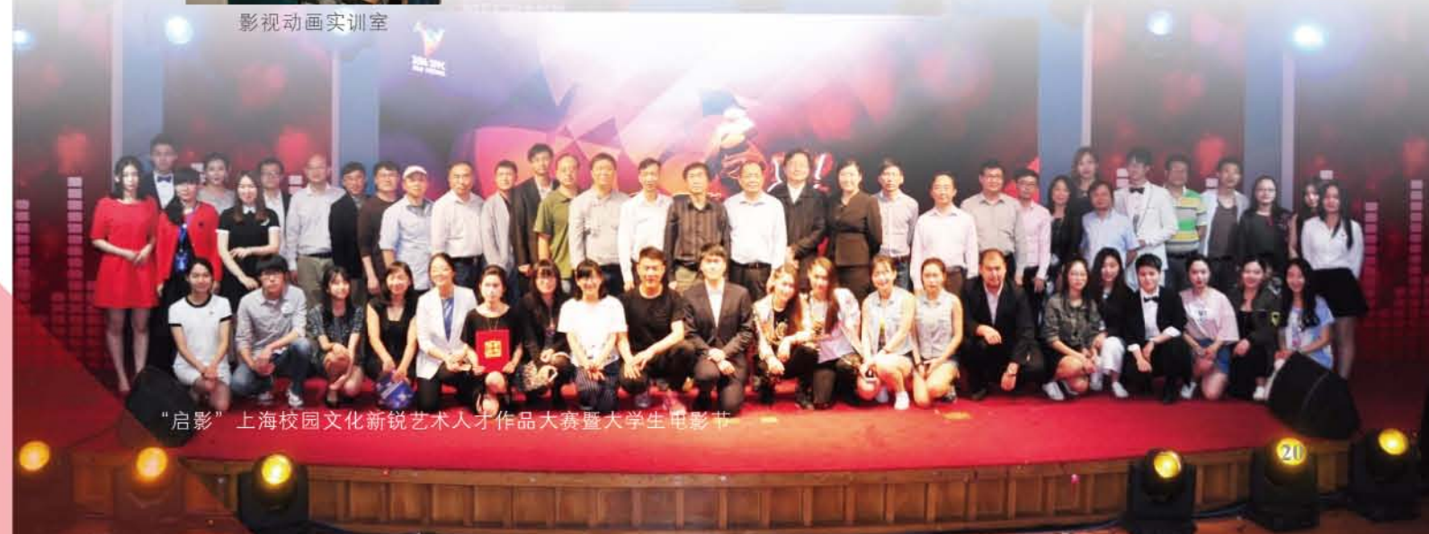
"启影"上海校园文化新锐艺术人才作品大赛暨大学生电影节