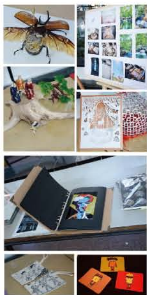
学校第二届 筑梦空间·创意集市隆重开幕

文化管理系是我校以日趋繁荣的文化产业及我国规模巨大的艺术品交易市场发展需要为背景而设立的系部。该系拥有一支学历层次高、结构优化、专兼结合的高素质师资队伍，实验实训项目内容丰富。文化管理系始终秉持“以应用为宗旨，以能力实训为主线，面向市场办学、紧贴岗位育人”办学理念，人才培养过程实施紧密型的校企合作，注重提升学生全面的文化素养，大力强化学生的实践能力培养，实施“双证”并重的人才培养制度。同时，积极引入国外先进的教育理念，着力推动文化艺术领域商科人才培养的国际化进程，文化管理系已与法国艺术文化管理学院、法国IPAG高等商学院、爱尔兰格林菲斯学院等国际院校合作开展“2+1”、“2.5+1.5”项目，为培养具有国际视野的应用技能型人才创造了有利条件。