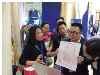
“印刷文化展示”——观众体验 雕版印刷游戏

印刷包装工程系成立于1953年，创办了新中国第一个印刷专业。目前开设有印刷媒体技术、数字图文信息技术、印刷媒体设计与制作、包装工程技术、包装策划与设计、数字印刷技术等专业和方向。该系专业特色显著，在国内印刷、包装、出版等行业具有很高的声誉，其中印刷媒体技术和数字图文信息技术专业是国家级重点建设专业，其他专业均为上海市重点建设和发展的专业。学生在世界技能大赛印刷媒体技术中连续获得铜牌和银牌。