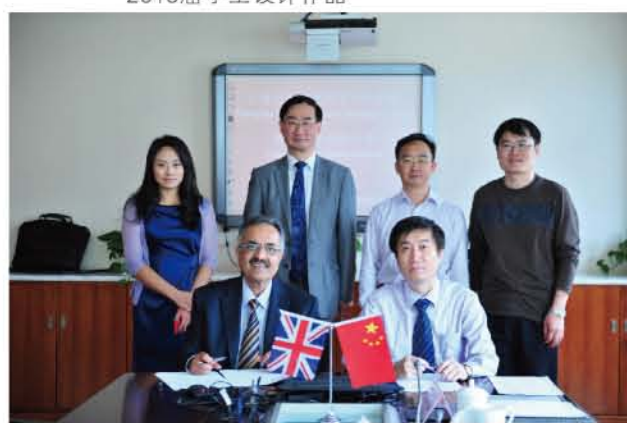
与英国贝德福德大学签定专升硕培养项目