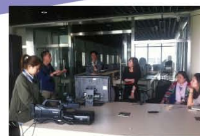
日本松下公司为教师开展专业培训