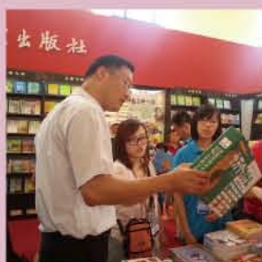
出版商务学生在上海书展实习

出版与传播系现有出版与电脑编辑技术（含“网络编辑方向”）、出版商务、广告设计与制作、会展策划与管理、数字出版5个专业。其中出版与电脑编辑技术专业为国家骨干高职院校重点建设专业，数字出版专业、出版商务专业为上海市重点建设专业（085工程）。各专业之间既相互区别又相互联系，组成了以信息的选择、组织、传播为特征的出版与传播专业群。