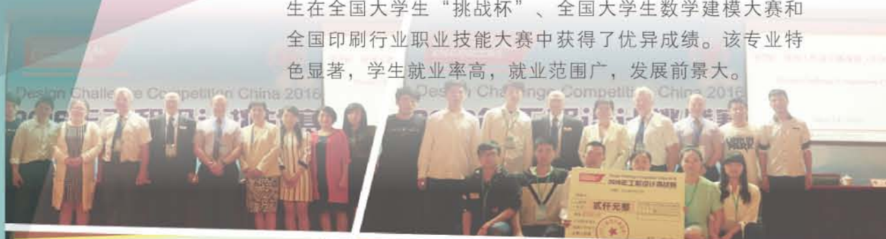
我校学生在第9届英国工程设计挑战赛（中国赛区）荣获最佳设计奖

机电一体化技术（印刷自动化）专业是上海市“085工程”重点建设专业，与国外院校建立了留学合作关系。学生在全国大学生“挑战杯”、全国大学生数学建模大赛和全国印刷行业职业技能大赛中获得了优异成绩。该专业特色显著，学生就业率高，就业范围广，发展前景大。