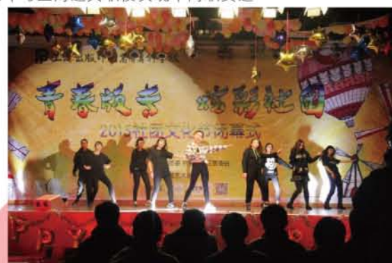
2015社团文化节闭幕式-ET舞社街舞表演