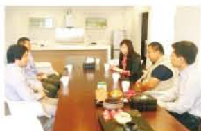
校领导赴企业调研

该专业立足于“德育为根本、就业为导向、技能为主线、工文艺结合”的办学理念，培养适应社会主义现代化建设需要的，德、智、体、美全面发展的，具有相应知识结构和素养的、有较强动手与创新能力的艺术设计人才。以数字交互艺术方向为主，培养具有现代设计理论与技能，基本素质高，实际操作能力强的数字媒体设计创意人才。开设的课程有交互式动画、网页设计、UI设计、多媒体设计、三维与展示设计、虚拟现实等，培养具有多方面能力的高素质技能型、应用型人才。