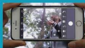
全国大学生广告设计大赛获奖作品