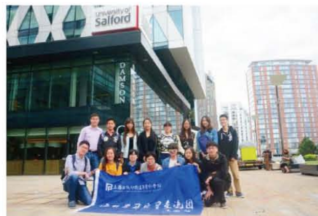
2015年学生海外实习交流-英国索尔福德大学