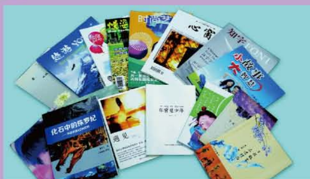
历届学生优秀毕业作品