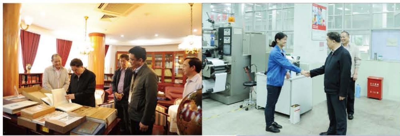
2016年5月，全国人大常委会委员、全国人大教科文卫委员会主任委员、原国家新闻出版总署署长、我校名誉校长柳斌杰来校视察。柳斌杰参观我校阅览室（左图），与第43届世赛银牌得主张淑萍亲切交流（右图）。

特色鲜明，底蕴深厚 ——学校坚持以就业为导向，工学结合，服务行业。多年的传承与积淀形成了工、文、艺相互渗透且有鲜明特色的“印刷工程与包装设计”、“出版传播与文化管理”、“艺术设计与影视动漫”三大专业群，专业已覆盖国家重点发展的10大门类文化产业。学校建有国际一流的实验、实训设施，包括现代传播科学实验中心（国家新闻出版总署重点实验室）、国家数字印刷工程研究中心、现代印刷实训中心（上海市公共印刷实训基地）、中-意印刷培训中心和数字印刷实训中心等24个实验、实训室。拥有北大方正、克里奥、爱克发等多家企业在学校设立的联合实训室，并与相关研究机构和企业建有120个教学实习基地。韬奋基金会、日本小森印务公司、德国曼罗兰印务公司、上海印刷集团、上海印钞集团、上海印包集团、雅昌印刷集团等20多家单位在学校设立了专项奖学金。