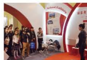
我校在上海教育博览会上展示 “互联网+教育”建设成果

该专业拥有国家优秀教学团队、国家精品资源共享课、国家级教学资源库，并拥有一支以省级教学名师、全国技能能手及拥有多种高级技能证书的“双师型”教师组成的高水平师资队伍。