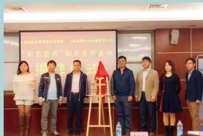
“创艺空间”创业实习基地揭牌仪式

该专业培养德、智、体、美全面发展，具有良好职业道德和人文素质，掌握数字出版物设计与制作技术、新媒体运营与发布知识，具备数字出版技术应用、策划与营销、经营、管理能力的高素质技术技能人才。