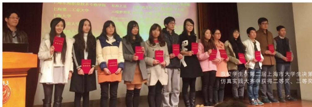
我校学生在第二届上海市大学生决策仿真实践大赛中获得二等奖、三等奖

该专业是上海市“085工程”重点建设专业，专业教学团队获得“上海市教学团队”荣誉称号。近年来学生“双证书”获得率在120%以上，就业率高达98%。自成立以来，出版商务专业一直紧跟行业发展的需要制定专业培养目标和培养计划，培养熟悉出版物生产流通环节，具有较强的市场调研分析能力和计算机信息处理能力，通晓版权事务，具备较强的出版物营销、电子商务、新媒体营销实际操作能力的高端技能人才。