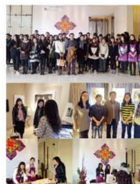
我校学生参加2015上海城市艺术博览会实习活动

艺术设计（艺术经纪）专业具有理论和应用性结合很强的交叉学科背景，该专业以美术基础和艺术史学习为基础教学内容，与艺术品鉴定、艺术设计、经济学、市场营销学、心理学、会计学等诸门学科相结合，将艺术展览策划、艺术设计、艺术管理、艺术营销等新型运用门类作为实践教学课程；以培养具有国际视野、艺术鉴赏眼光、市场经营头脑、沟通组织才能的懂艺术又擅经营的复合型人才。