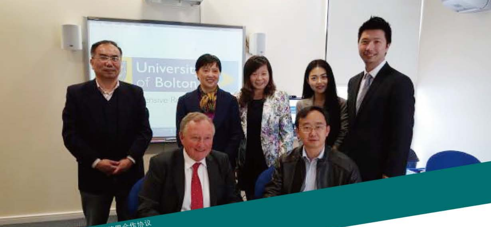
与英国博尔顿大学签署合作协议