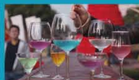
全国大学生广告设计大赛获奖作品

该专业教学将以台词、声乐、形体和表演四大板块为核心，与影视艺术系其他专业构成生态互动教学体系，采取课堂教学与社会实践互补相结合，其中每学年通过社会和学校的戏剧影视项目来带动教学实践和作品创作。既加强学生的专业性，也注重其社会适应性和可塑性，通过并建立演员数据库，适时联通影视实训基地，持续关注学生的职业发展。