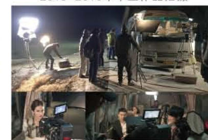
2015年1月，师生在电影《夜幕降临》拍摄现场进行现场教学实训