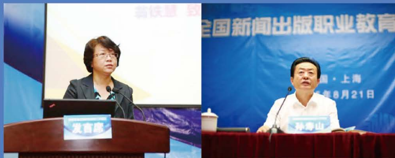
2015年8月，全国新闻出版职业教育工作会议在我校举行，上海市副市长翁铁慧致欢迎辞（左图），国家新闻出版广电总局党组成员、副局长孙寿山做主题报告（右图）。

专本硕连读的起点站 ——学校积极推进现代职业教育体系的构建，贯通人才培养层次，打通从中职、专科、本科到专业硕士的上升通道，解决学生、家长的后顾之忧。我校毕业生专升本就读的学校有上海理工大学、上海大学、华东政法大学、上海戏剧学院、上海师范大学、上海工程技术大学、上海第二工业大学、上海电力学院、上海应用技术大学等院校。我校加入了上海理工大学的大学体系，每年专升本率在15%左右，在专升本的学生中又有20%左右可考取硕士研究生，部分优秀毕业生还可被推荐到国外就读本科生、研究生。