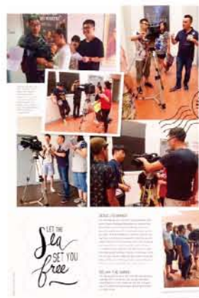
2015年学生海外实习交流 法国3IS电影学院

该合作办学项目旨在全球文化产业与文化市场大发展背景下，培养具有国际视野和创新意识，面向文化出版传媒及文化服务领域，具有创意策划、公关调研、开拓创新和组织营销能力，有较高的商务管理理论和实践能力兼备的复合型、开拓型和创造性的文化媒介与版权经纪应用型人才。