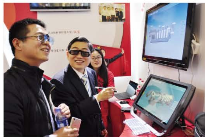
我校在上海教育博览会上展示 “互联网+教育”建设成果