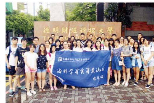
2015年学生海外实习交流-台湾德明财经大学