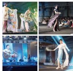
上海校园文化新锐艺术人才作品大赛暨我校第十一届服装设计大赛

浓郁的行业背景和创新的管理模式孕育了上海出版印刷高等专科学校特色鲜明的毕业生就业工作。