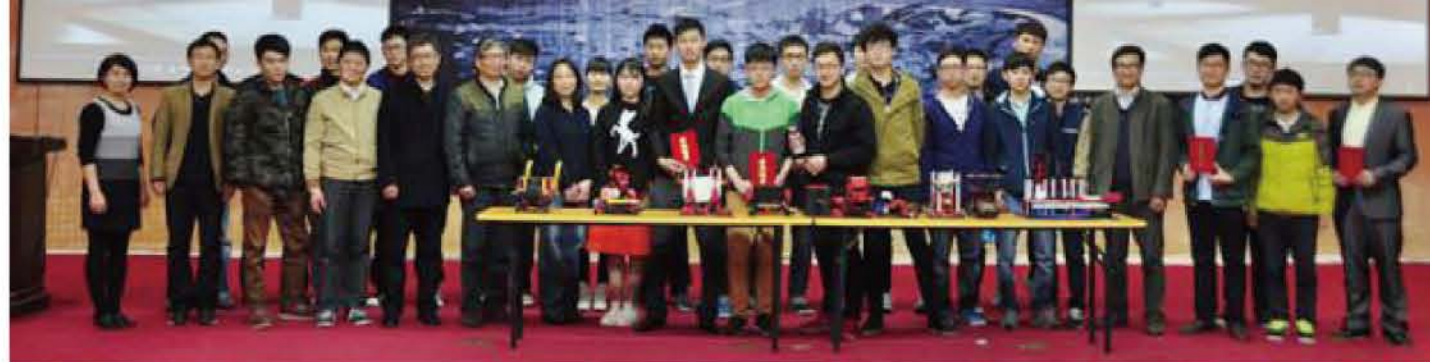
我校“机械创新暨第四届机器人创意设计大赛”隆重举行