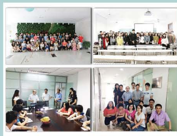
顶岗实习学生与校外实践基地公司互动合影