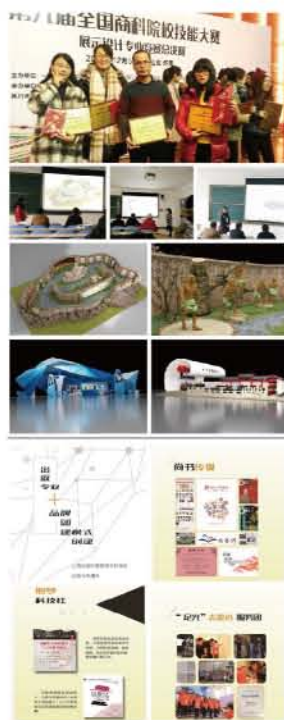
我校学生在第九届全国商院校展示设计大赛中荣获一等奖、二等奖、三等奖、优秀组织奖