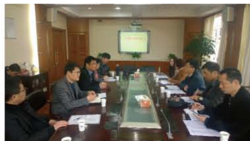
2014年与上海逸夫职校实现中高职贯通