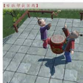
“印刷文化展示” 雕版印刷游戏场景

印刷包装工程系成立于1953年，创办了新中国第一个印刷专业。目前开设有印刷媒体技术、数字图文信息技术、印刷媒体设计与制作、包装工程技术、包装策划与设计、数字印刷技术等专业和方向。该系专业特色显著，在国内印刷、包装、出版等行业具有很高的声誉，其中印刷媒体技术和数字图文信息技术专业是国家级重点建设专业，其他专业均为上海市重点建设和发展的专业。学生在世界技能大赛印刷媒体技术中连续获得铜牌和银牌。