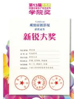
学校师生斩获第十三届中国大学生广告艺术节学院奖原创影视新锐大奖

影视艺术系是上海出版印刷高等专科学校为适应当下文化产业的蓬勃发展而开设的新系。三年来依据影视艺术自身办学的规律定位，坚持严谨科学的专业建设和教学管理，结合上海经济文化的发展，特别是影视行业的发展需求，不断优化专业结构，完善专业体系，拓展就业渠道，并取得了不俗的成绩。