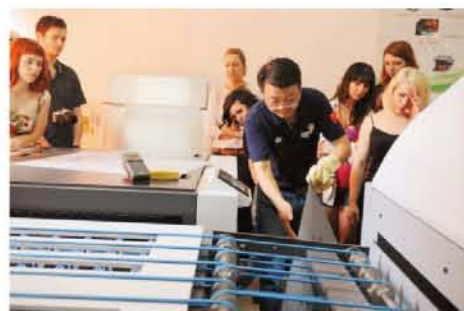
澳大利亚埃迪斯科文大学师生来我校实习交流