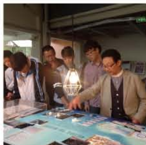
学生在大师工作室实践

该专业作为教育部骨干校重点建设专业之一，注重对学生进行艺术设计专业基础知识、艺术修养、审美素质和实际操作技能等方面的培养，尤其重视印刷工艺基础知识和平面创意设计。该专业的学生创意与技能兼具，基本素质高、操作能力强、了解印刷工艺，是平面创意设计、印刷品设计制作行业紧缺的多方位应用技能型设计人才。