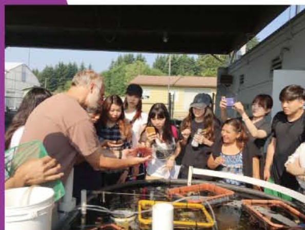
2015年学生海外实习交流-温哥华大学

该合作办学项目旨在日趋繁荣的艺术品市场背景下，培养具备艺术、文史哲等基本理论知识，有着较强的商务谈判、经营策划能力，具有国际视野和创新意识，掌握艺术鉴赏、艺术品市场营销、拍卖、画廊管理等理论与操作实务，从事艺术品投资、交易与管理的复合型艺术经纪专业技术人才。