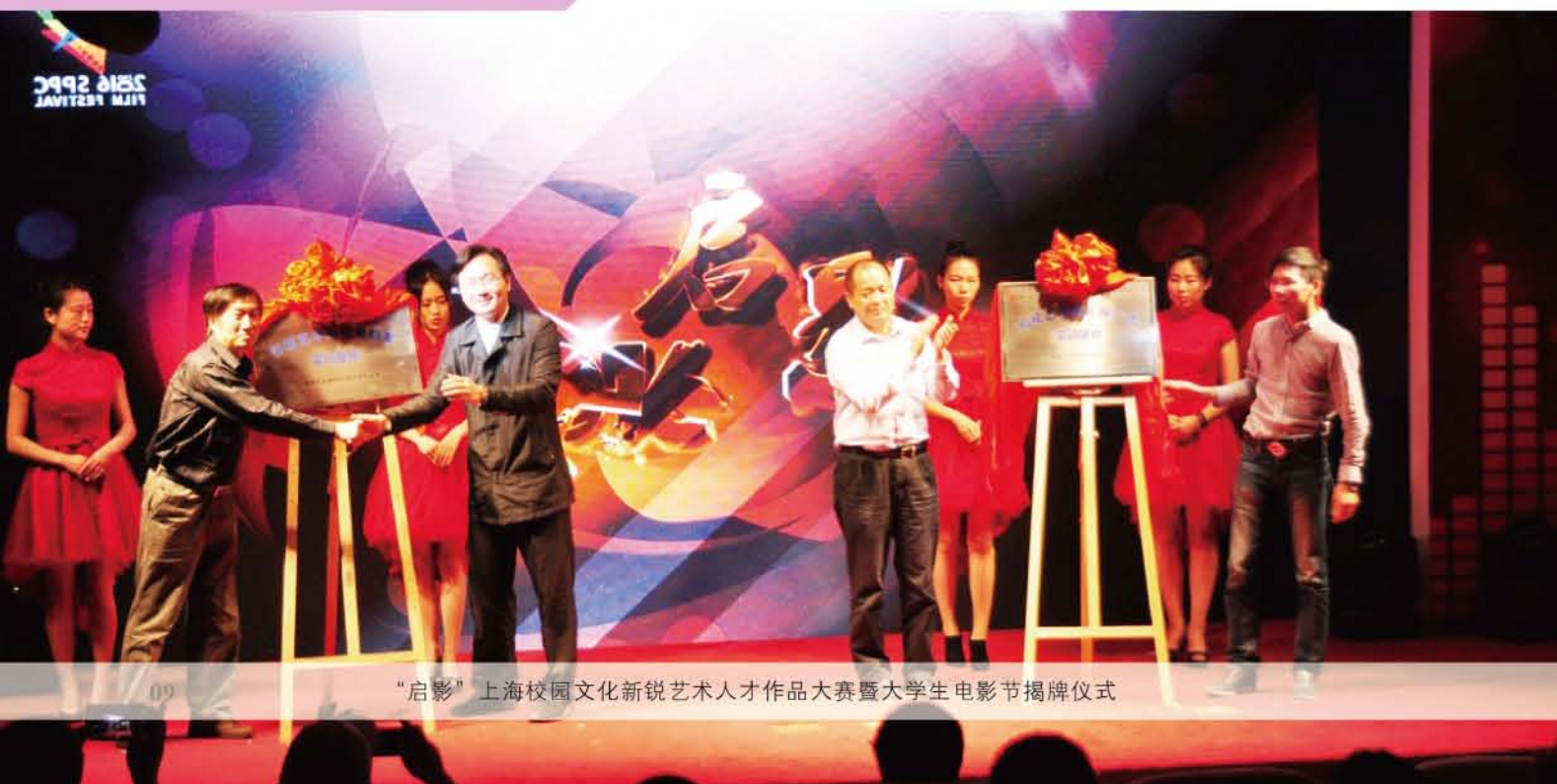
“启影”上海校园文化新锐艺术人才作品大赛暨大学生电影节揭牌仪式

该专业被上海市确定为一流建设专业，培养德、智、体、美全面协调发展，具备良好包装设计基本素质，在现代包装策划、设计与开发、包装技术与工艺应用、包装印刷与印后加工、包装印刷营销和管理上受到良好训练的包装设计高级复合型技术应用人才。该专业具有技术与设计并重、理论和实际应用相结合、校企合作培养的显著特色。