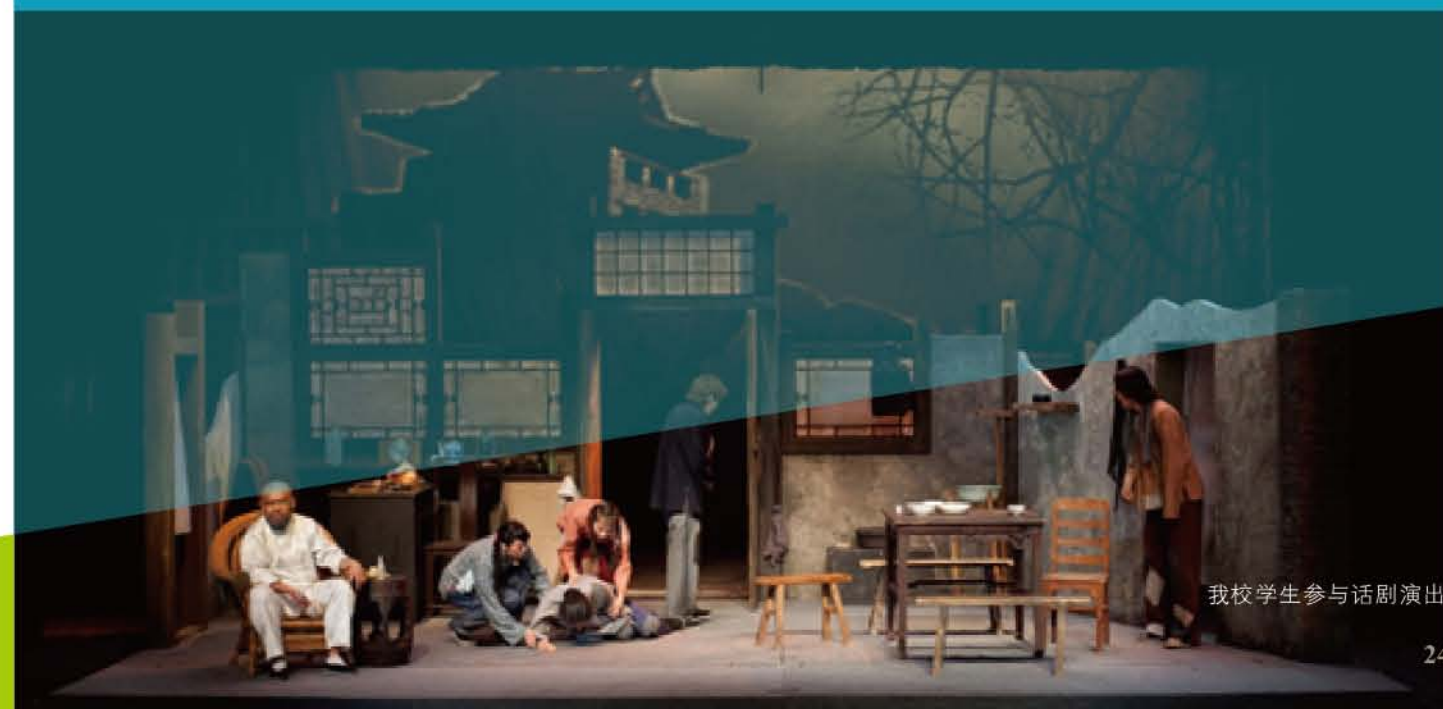
我校学生参与话剧演出