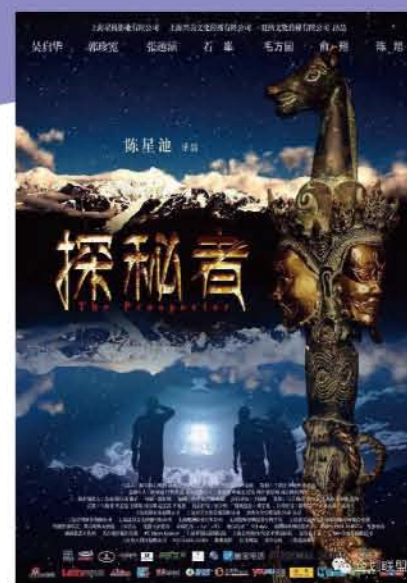
2015年12月31日，本专业师生参与联合摄制的电影《探秘者》在全国院线上映