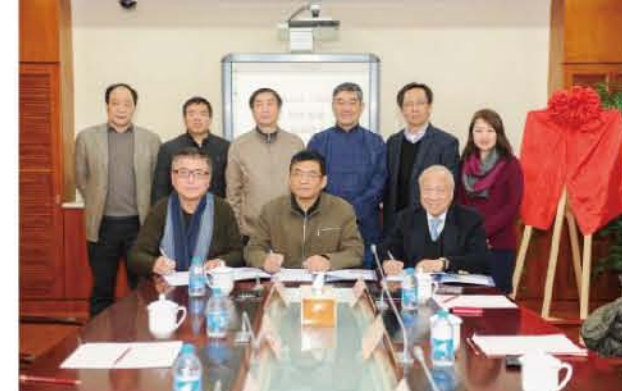
我校与香港印刷科技研究中心、上海市印刷行业协会合作 建立“Idealliance - China G7 培训基地”