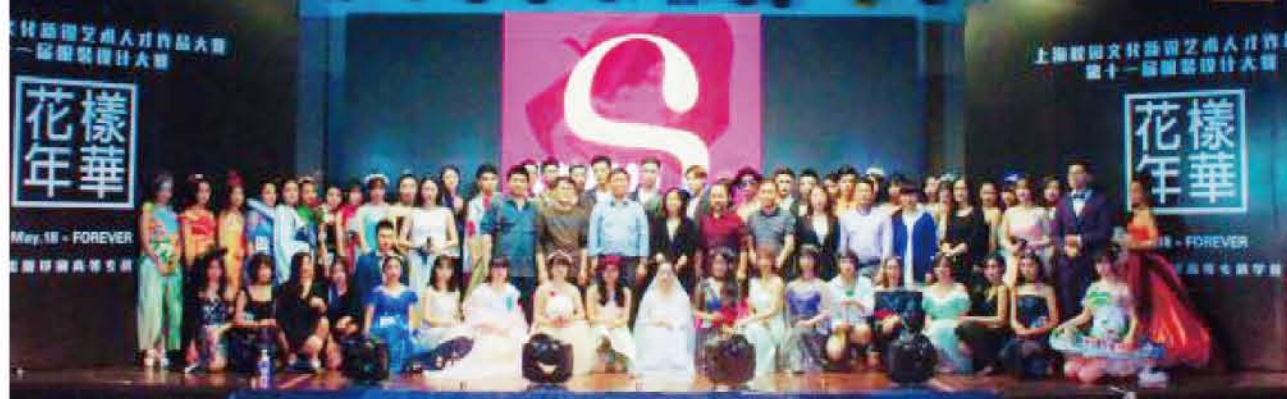
上海校园文化新锐艺术人才作品大赛暨我校第十一届服装设计大赛