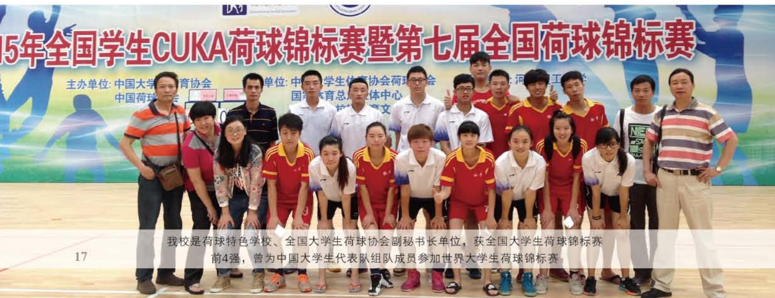
我校是荷球特色学校、全国大学生荷球协会副秘书长单位，获全国大学生荷球锦标赛前4强，曾为中国大学生代表队组队成员参加世界大学生荷球锦标赛

会计专业是培养熟练掌握会计、审计、财务管理等基本理论及技能，具有较强动手能力，能够在各企事业单位从事会计、财务管理、审计实务的高素质技能型人才。课程设置以实用性为主，注重会计岗位实训，构建“岗证赛融合”的专业实践教学体系，采取以赛促教，以证促教人才培养模式，增强了学生岗位的适应性和就业的竞争性。