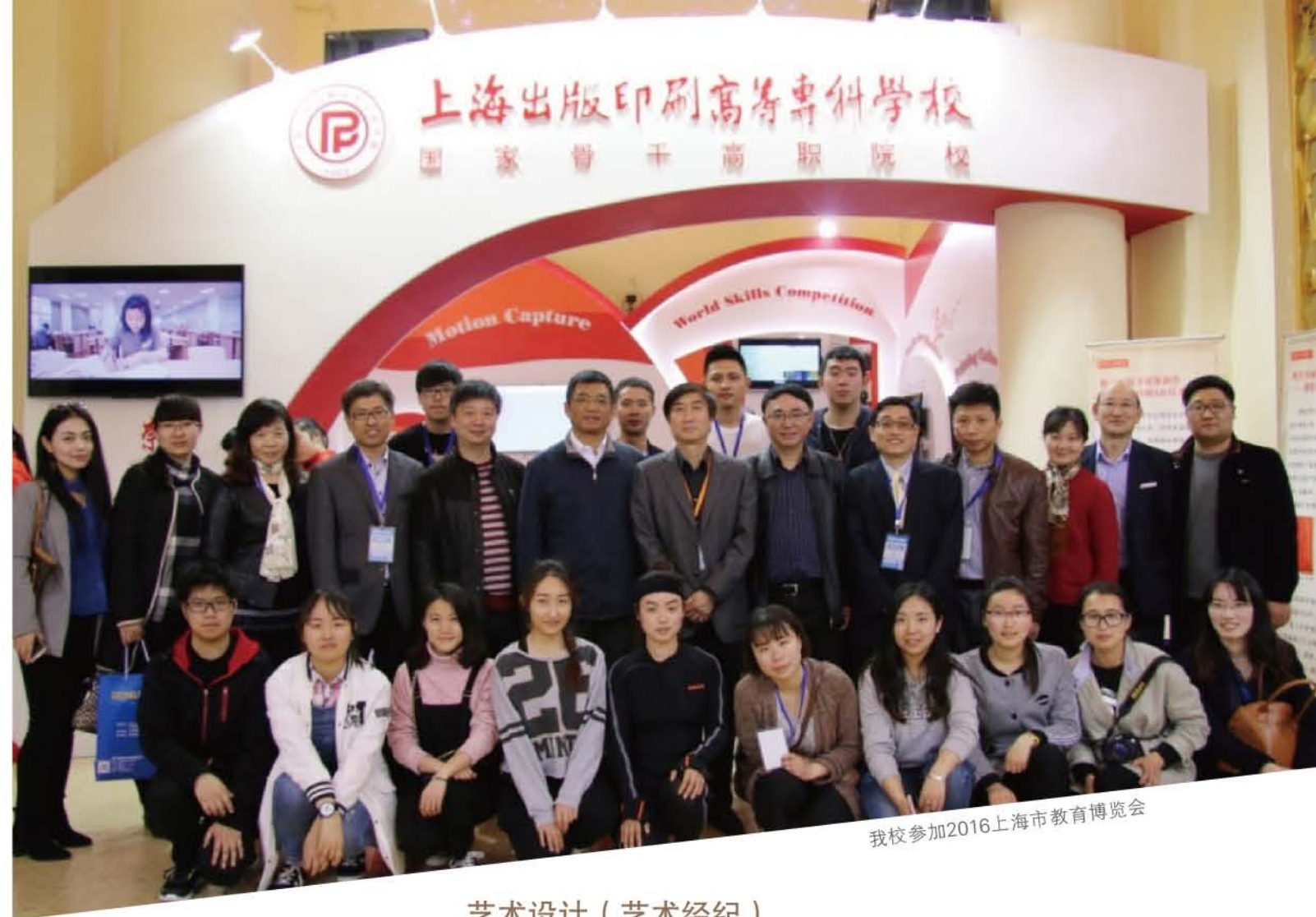
我校参加2016上海市教育博览会